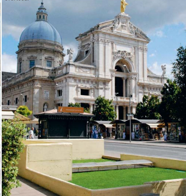
De Basilica di Santa Maria degli Angeli, gebouwd rond de kapel waar Franciscus overleed.

hostie in zijn handen begon te bloeden. We schrijven 1263 en de verbaasde twijfelbaar probeerde het mirakel eerst nog weg te moffelen, maar het altaar en het altaarkleed waren al met bloed besprenkeld. De goegemeente juichte en hield het jaar daarop een processie om het wonder te herdenken, en is dat tot vandaag de dag blijven doen, tijdens het tweede weekend na Pinksteren.