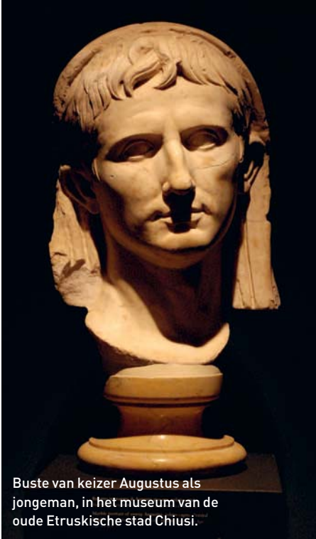
Buste van keizer Augustus als jongeman, in het museum van de oude Etruskische stad Chiusi.

Het marktplein van Montepulciano, dat ooit nog gesticht werd door inwoners van Chiusi, maar nu eigenlijk in Toscane en niet in Umbrië ligt.