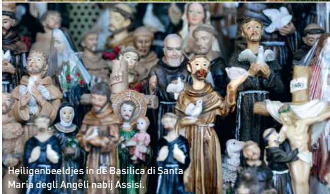
Heiligenbeeldjes in de Basilica di Santa Maria degli Angeli nabij Assisi.