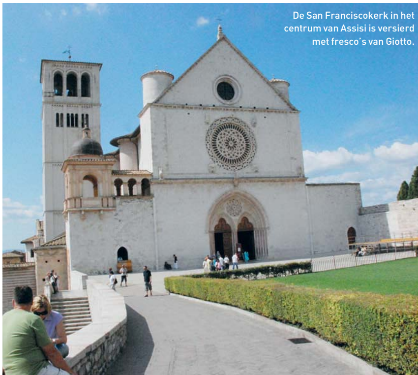
De San Franciscokerk in het centrum van Assisi is versierd met fresco's van Giotto.