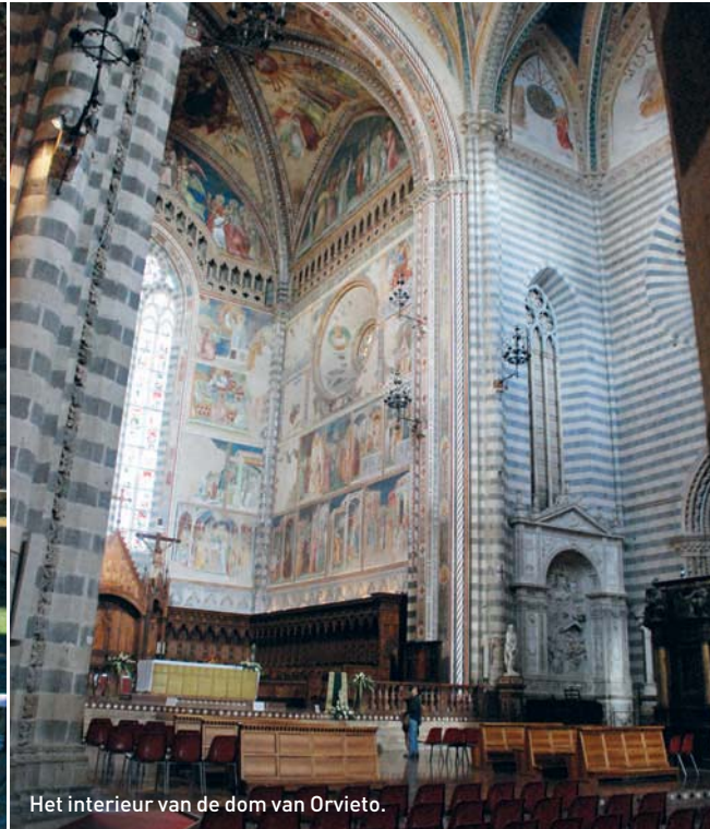
Het interieur van de dom van Orvieto.