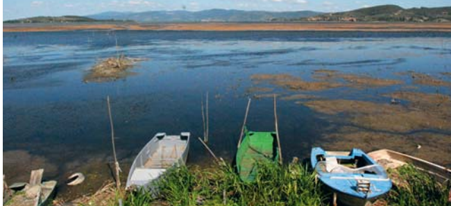
Het Trasimeense meer.