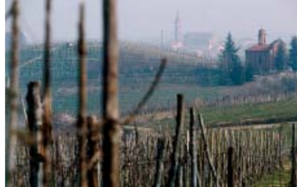
Boven: In een doolhof van kelders rusten de wijnen van Castello Di Neive.