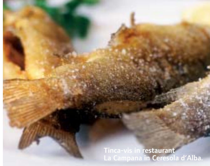
Tinca-vis in restaurant La Campana in Ceresola d'Alba.