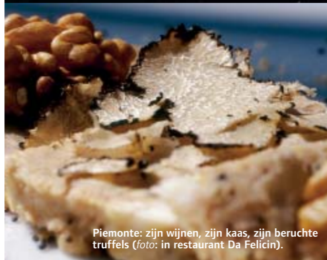
Piemonte: zijn wijnen, zijn kaas, zijn beruchte truffels (foto: in restaurant Da Felicin).

> steekt Nino nog een tandje bij. Op onze vraag wat die Italiaanse keuken nu zo populair maakt, antwoordt hij: "Eigenlijk is er amper verschil tussen de Japanse en de Italiaanse keuken. Beide zijn simplistisch georiënteerd, oorspronkelijk bedoeld voor een arm volk. Precies dat maakt ze zo eerlijk. Trouwens, wat mij betreft, bestaat 'de' Italiaanse keuken of 'de' Chinese keuken niet. Er zijn te veel regionale verschillen. Is dat een goed antwoord?" We lachen en heffen het glas. De zon staat al laag wanneer we vertrekken voor de laatste ruk van de tocht. Die brengt ons naar La Morra en Verduno. Onderweg sterft de zon. Het wordt oranje, het wordt rood. Het is donker.