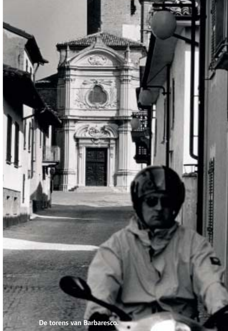
De torens van Barbaresco.