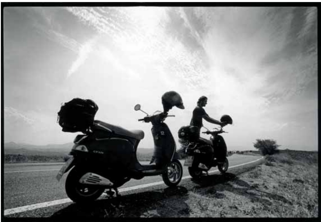
Met de auto op twee wielen, tegen een natuurlijk ritme, langs de landelijke Montagnola tour.