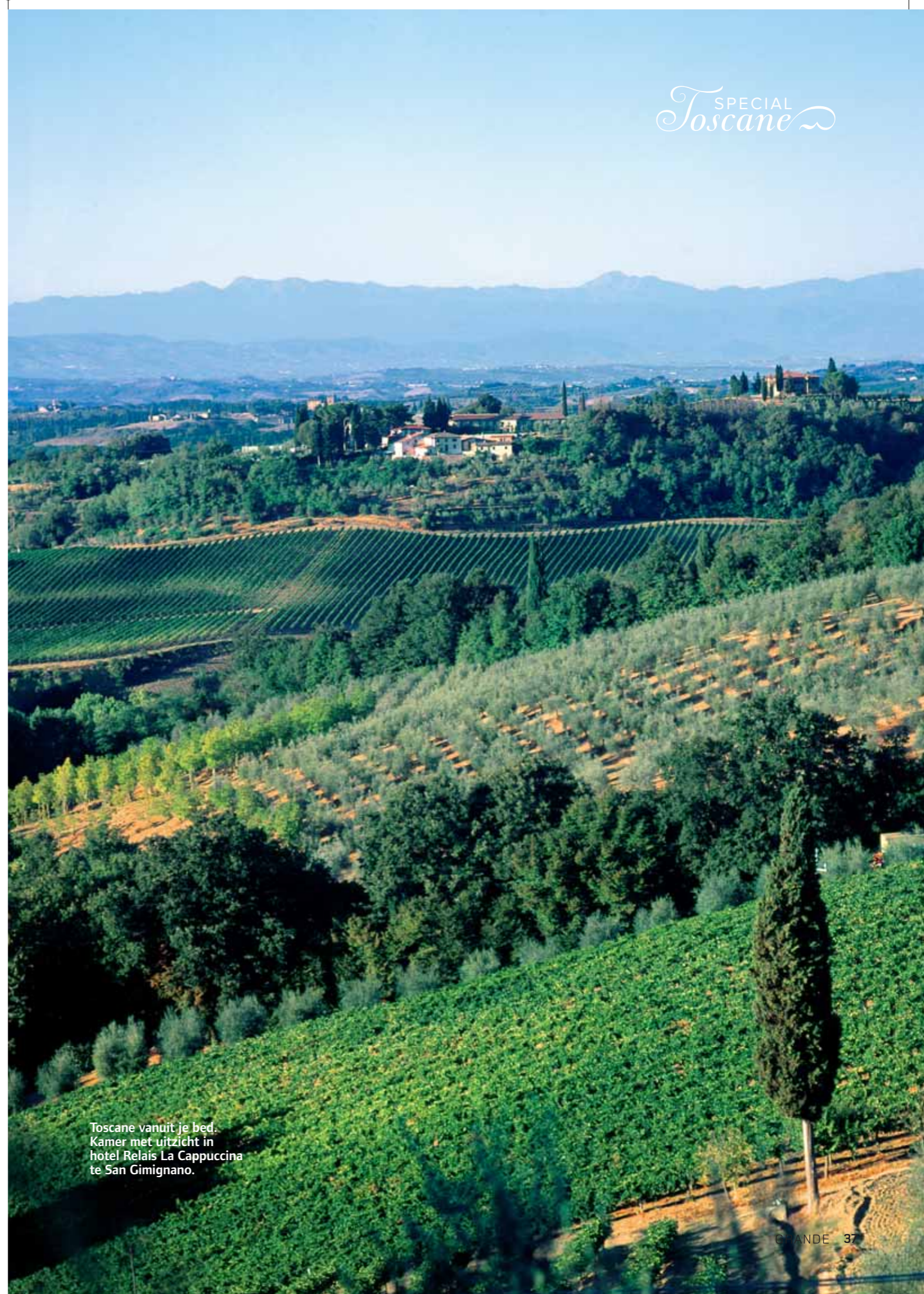
Toscane vanuit je bed. Kamer met uitzicht in hotel Relais La Cappuccina te San Gimignano.