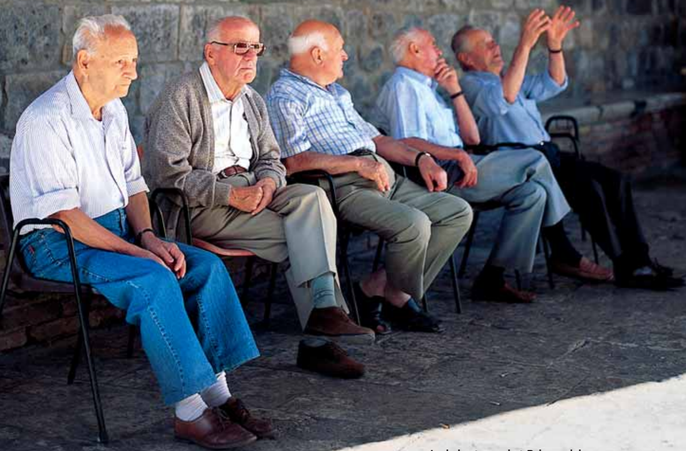
In de luwte van het Palazzo del Popolo in San Gimignano wordt alles besproken, dus ook de vrouwen!

San Gimignano, Volterra, Chianti, Monteriggioni: het kan met de wagen, de fiets of te voet. Maar het kan nu ook in de sfeer toen 'la vita' nog 'dolce' was: met de vespa, de roemrijke Italiaanse scooter. Traag reizen, intensief genieten door het mooiste stukje Italië.