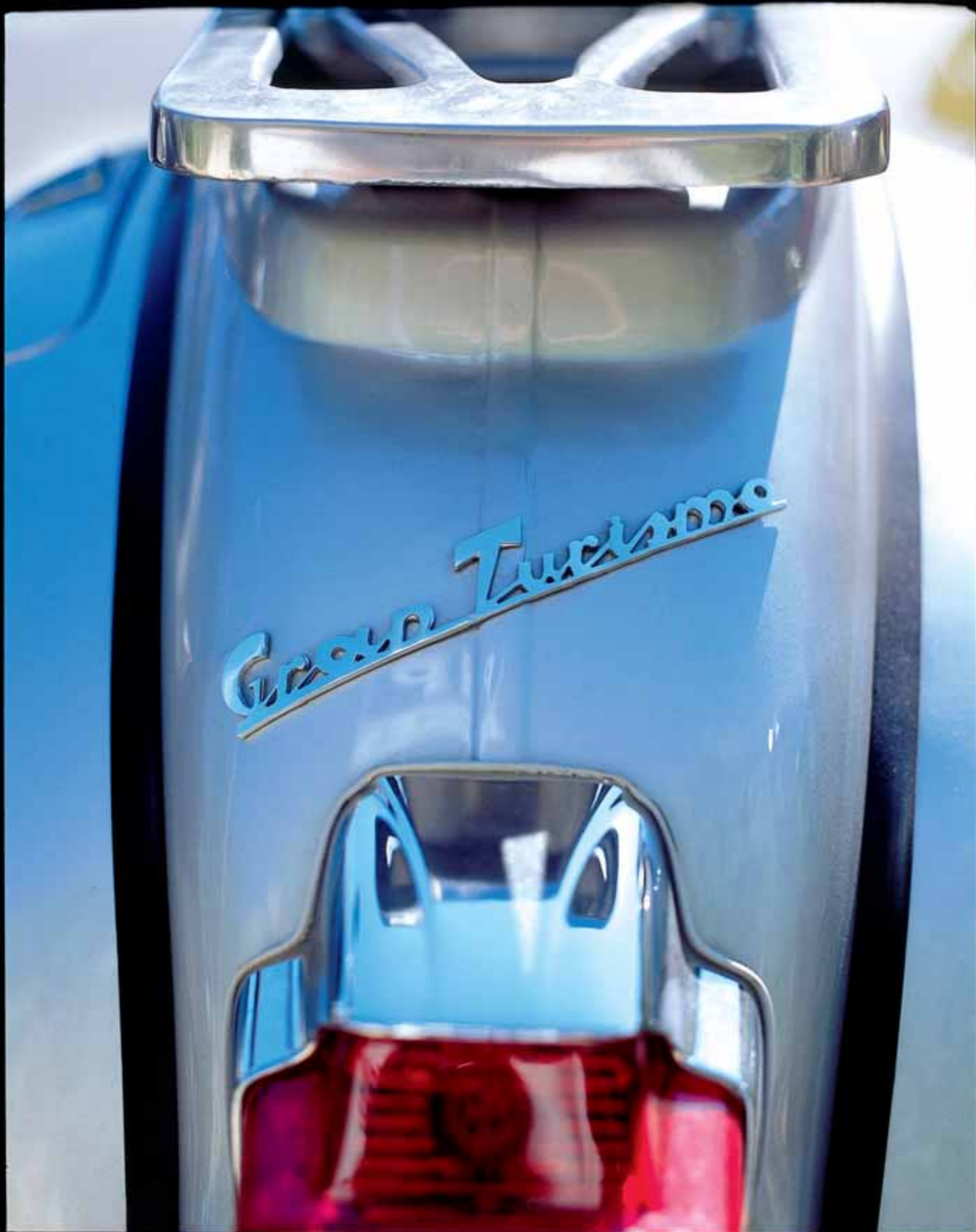
Oldtimervespa in Monteriggione. Een Vespa heeft totaal geen agressieve look. Vele Italianen leren dan ook rijden op hun auto met twee wielen.