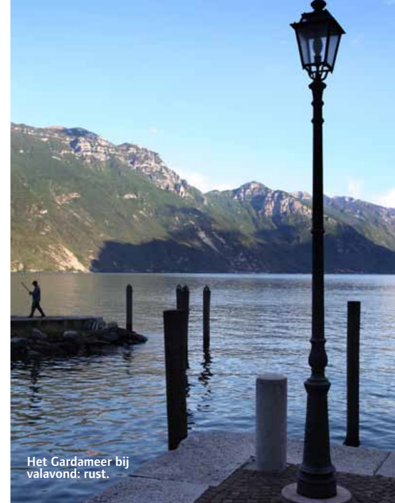
Het Gardameer bij valavond: rust.