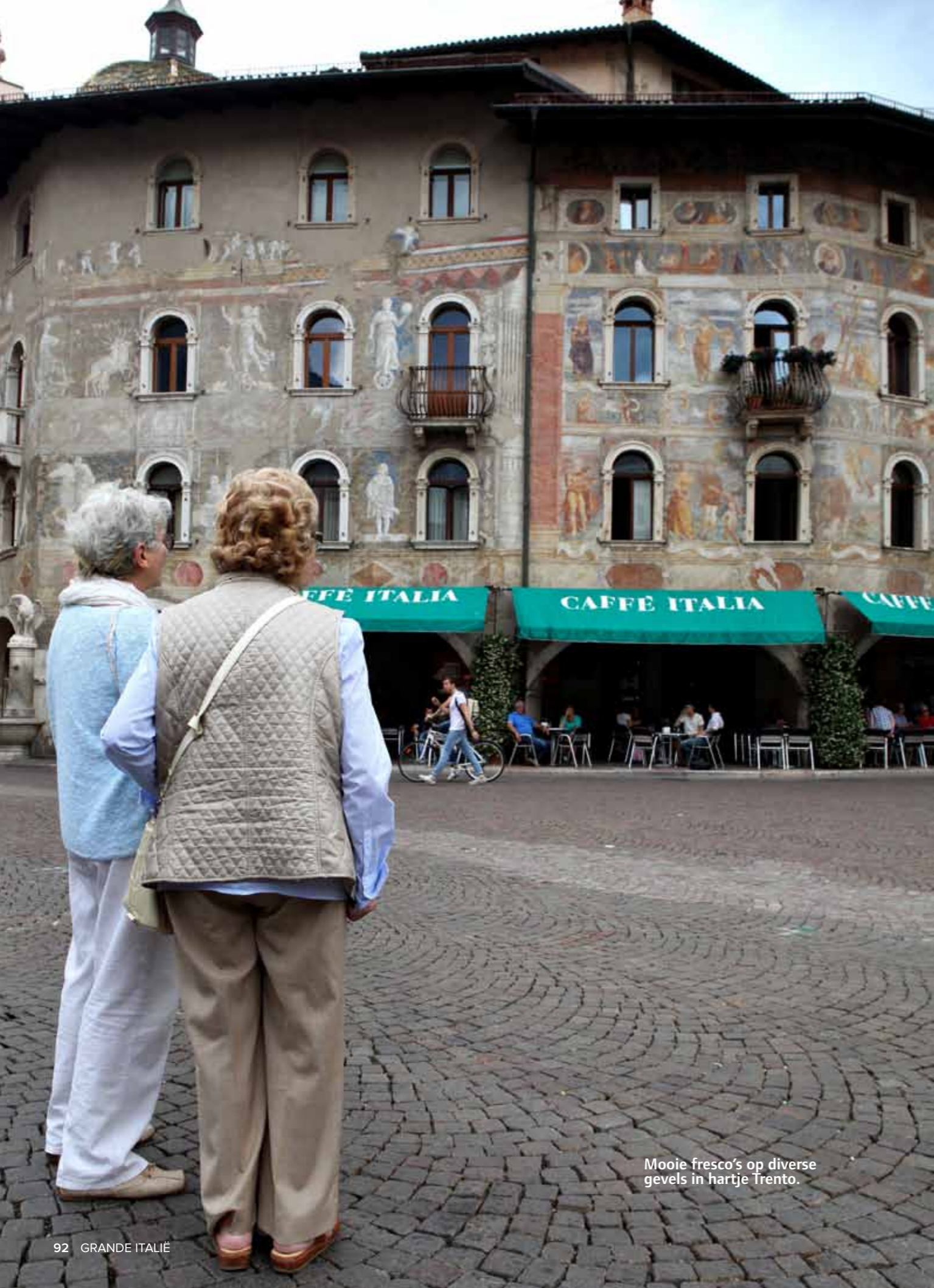
Mooie fresco's op diverse gevels in hartje Trento.